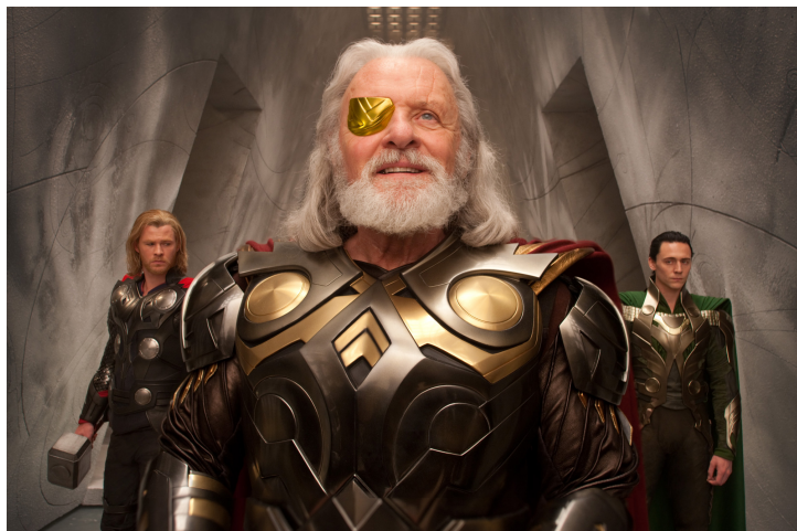
A Thorban Asgard – Odin szavaival – „reménysugár, mely átragyog a csillagok között”; vajon ez a 21. század eleji Egyesült Államok allegóriája?

Kivételes harci bátorságuk ellenére egyértelmű, hogy az asgardiaiak kisebbségben vannak és gyengébbek, a vereség pillanatában azonban mitikus nyolclábú lován, Sleipniren lovagolva Odin tűnik fel. „Atyám! Együtt végzünk velük!” – szólítja Thor az apját, ami erősen megidézi, hogyan gondolt sokak szerint George W. Bush az iraki háborúra. [8] Odin azonban figyelmen kívül hagyja a fiát, és Laufey-hez fordul: „Ezek egy fiú cselekedetei, kezeld akképpen” – s ez a második eset néhány percen belül, hogy Thort fiúnak nevezik. Laufey azonban nem áll kötélnek, és a civilizációk összecsapása [9] az asgardiaiak és a Jégóriások között újakezdődik.