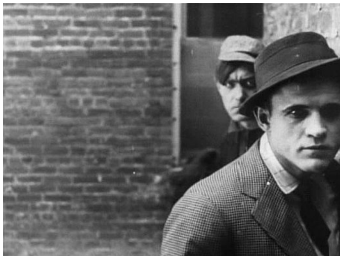
A Pig Alley testőrei (The Musketeers of Pig Alley. D. W. Griffith, 1912)

Tanított bennünket, mondtam, mert igenis téged is tanított, fejlesztett, csak nem veszed tudomásul. Mert ugye minap is voltál azért moziban, mint mondani szoktad, a feleséged kedvéért. De ez gyakran szokott előfordulni, és te, ha fanyalogva nyilatkozol is a filmről, de megértetted, igaz-e a történet, melyet ábrázol? És én azt állítom, hogy húsz év előtt ugyanezt a filmet egyszerűen nem értetted volna meg, mert látásod még nem volt hozzáfejlődve. Nem hiszed? Bizonyítom.